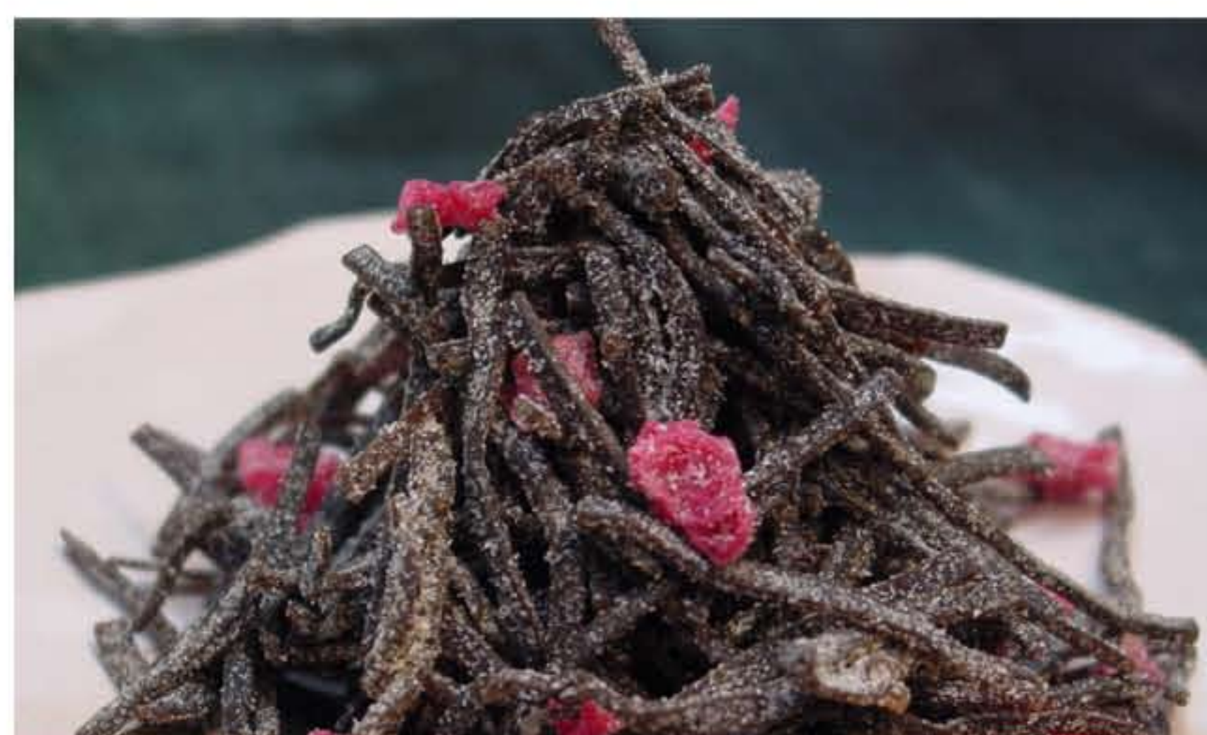
厳選した国産梅の酸味が効いた逸品