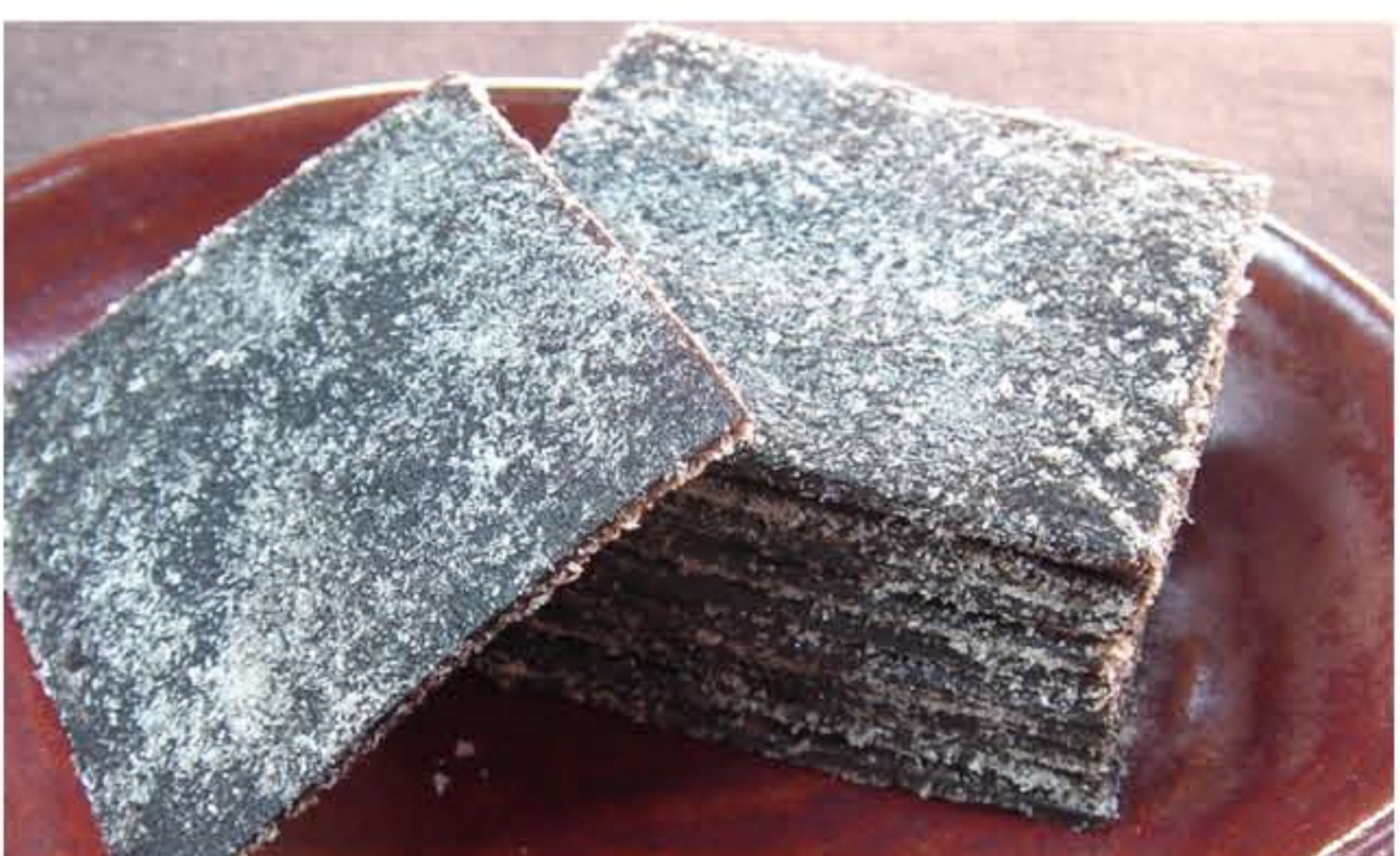
道南白口浜産の一等検の真昆布のみを使用