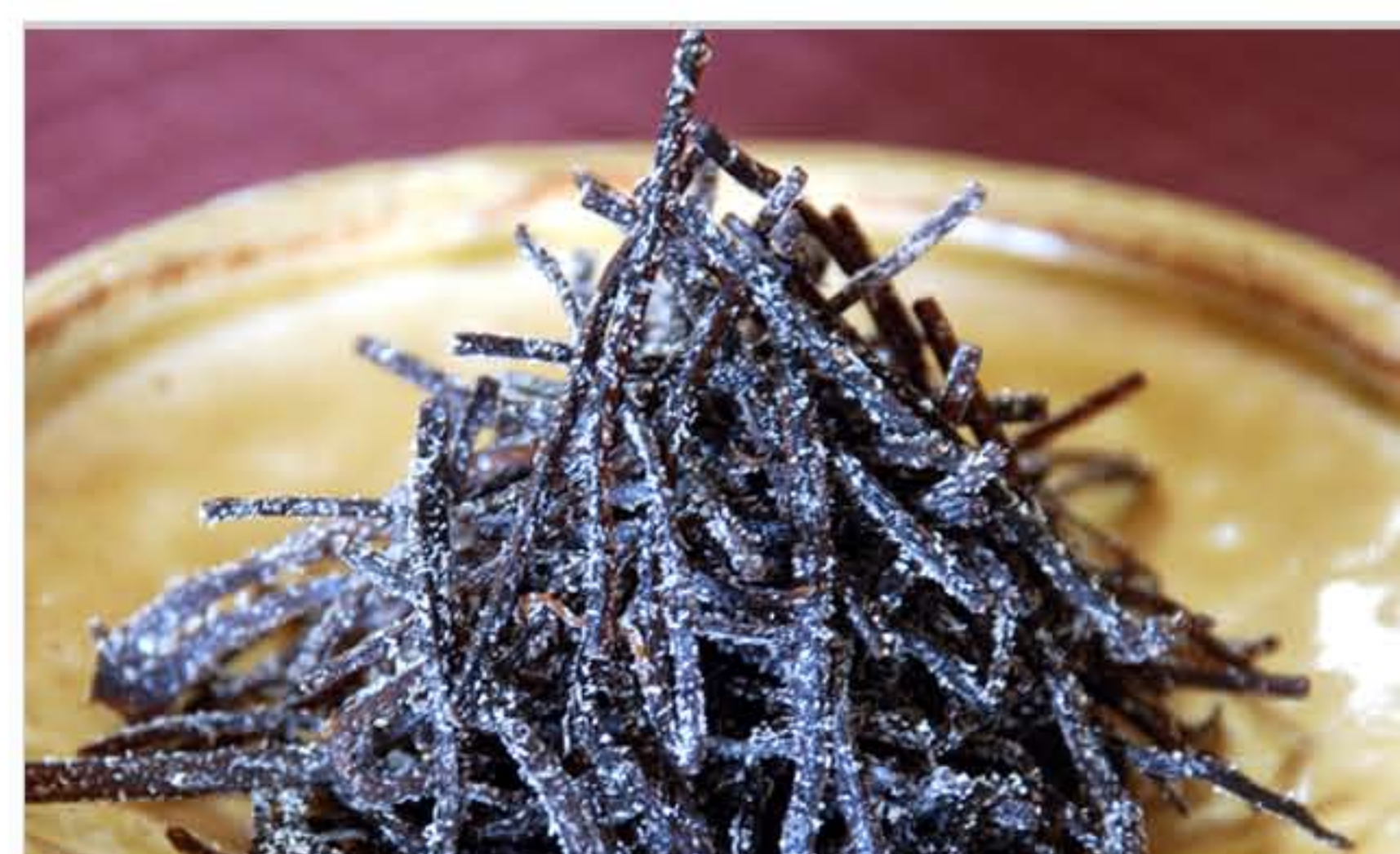
天然真昆布を細切りにした上品な味

北海道の天然真昆布 紀州の梅など 厳選素材を職人が 伝統の技で仕上げた 佃煮の数々：