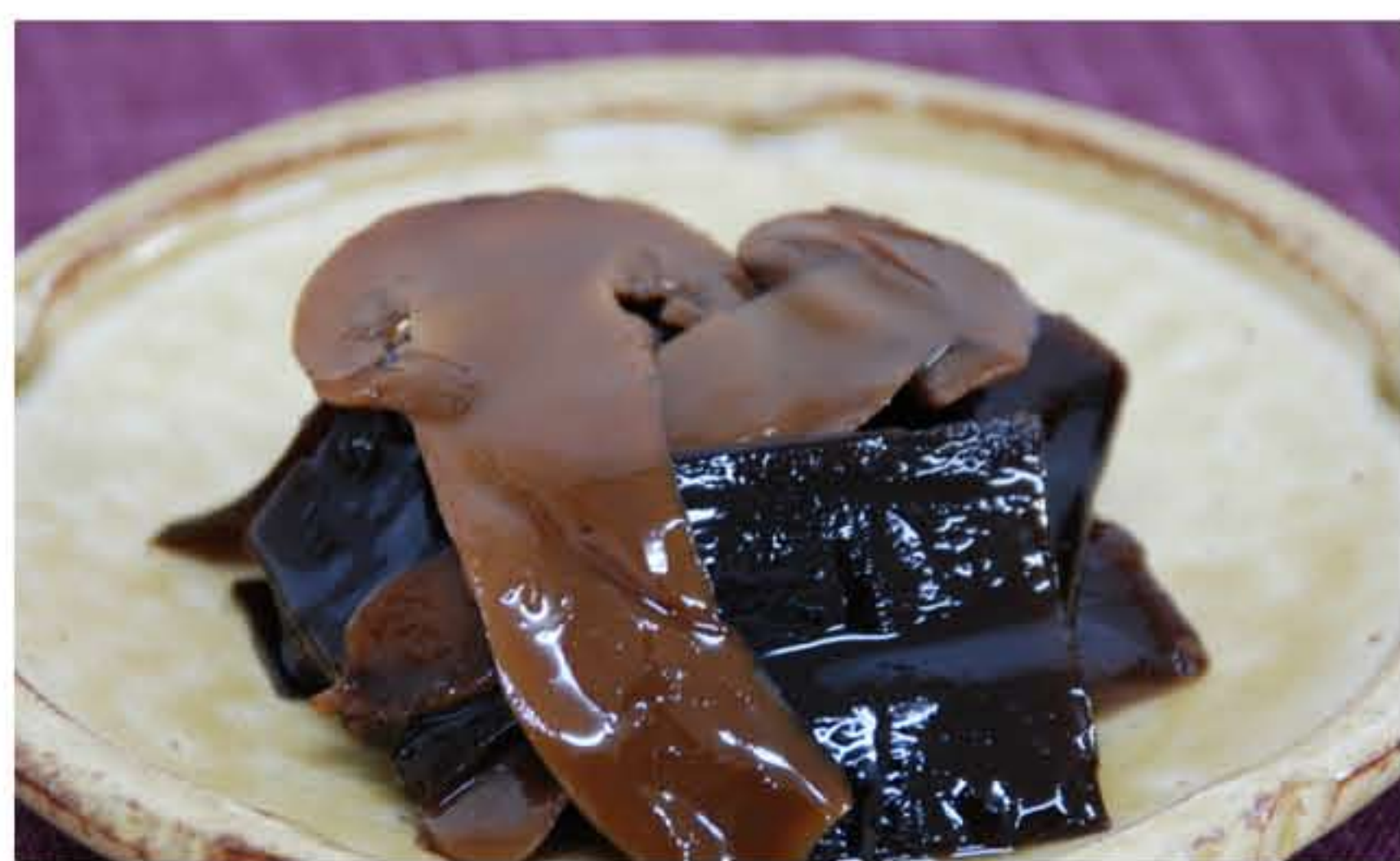
松茸を贅沢に使った昆布佃煮